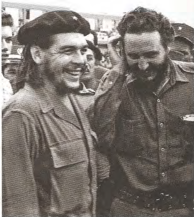
Ernesto Guevara (El Che) y Fidel Castro, 1960.

Latinoamérica debería de conocer. Su nuevo libro llevará por nombre Cuba: apuntes de un viajero . No promete ser un anecdotario, sino el recuento del quehacer científico de un sociólogo experto, motivo por el cual le preguntamos sobre la reacción política de ambos gobiernos. ¿Qué significa que ambos gobiernos se acerquen?