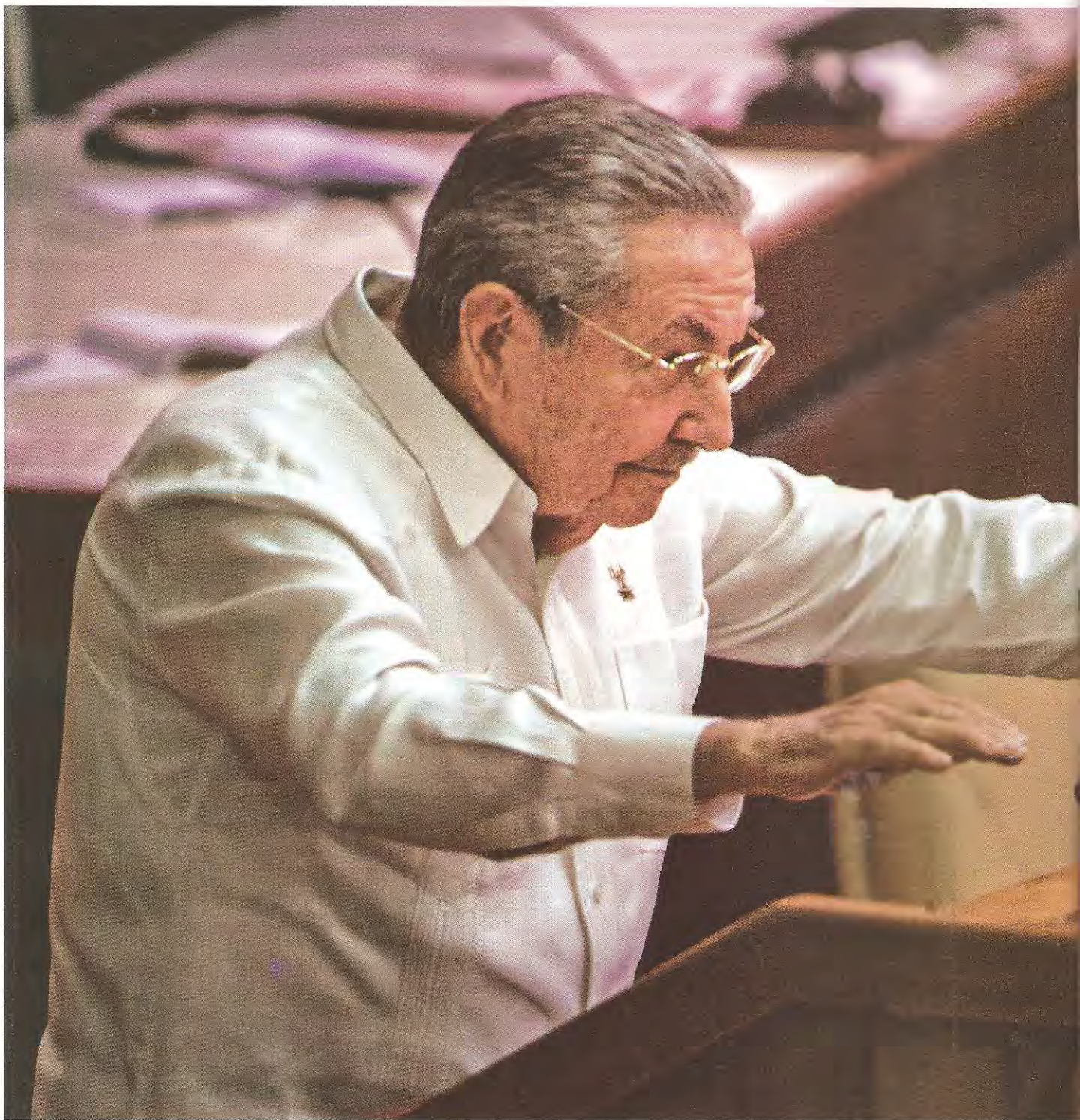
El presidente Raúl Castro en el parlamento cubano, diciembre 2014.