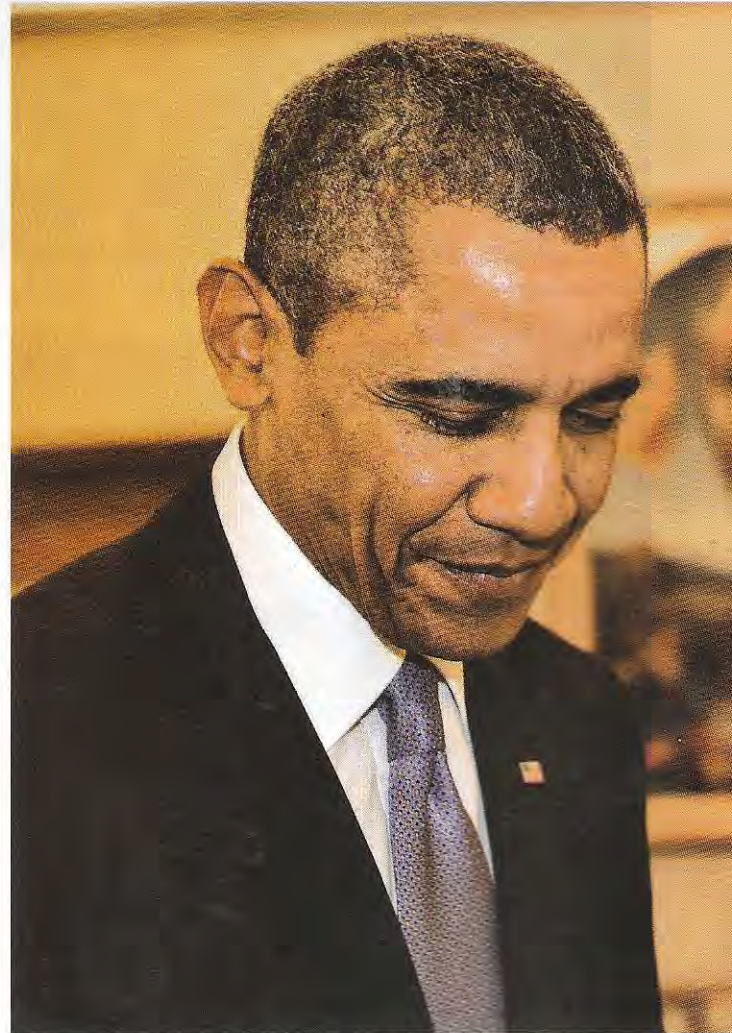
El presidente Obama y el papa Francisco, marzo 2014.

La desigualdad social de América Latina no es entendible desde la realidad cubana, la cual podría verse afectada una vez que Cuba admita una apertu-