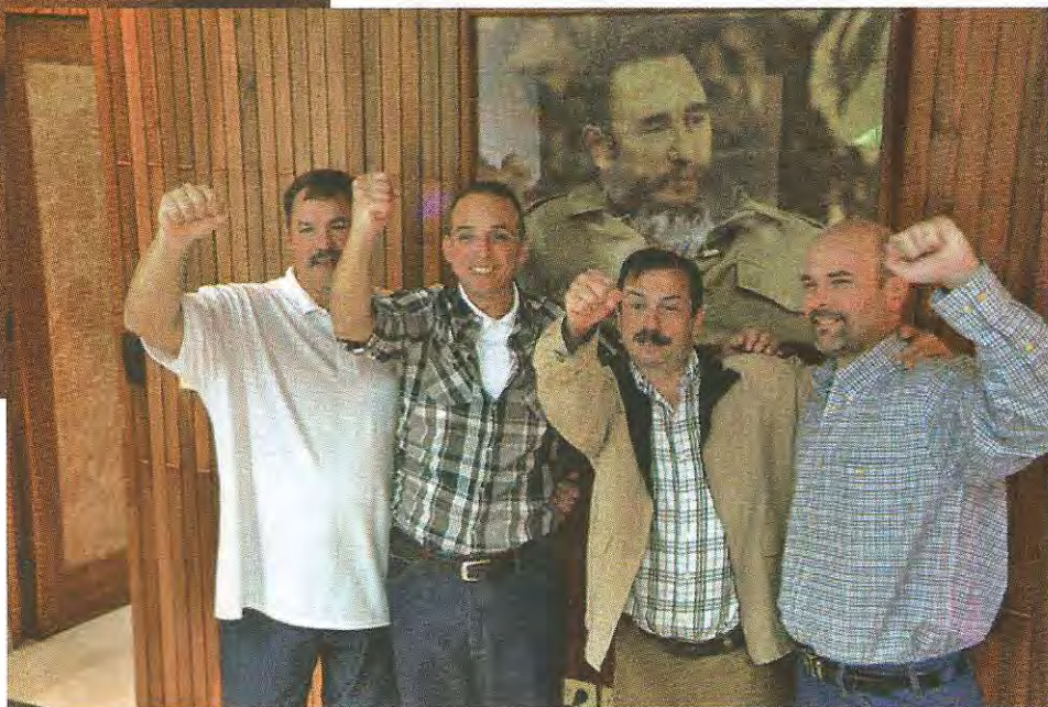
Cuatro de los Cinco Héroes Cubanos en su regreso a la isla, diciembre 2014.

La Revolución Cubana ha sido generadora de conciencia social.